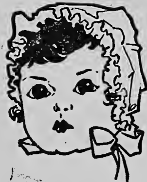
Baby has improved a great deal... on